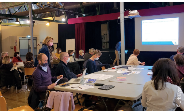
Atelier de travail

Ce travail de co-construction a fait l'objet d'une note à destination des élus. Cette note présente pour chaque enjeu thématique les chiffres repères du territoire, les chiffres repères de santé publique, les grandes « familles » d'actions avec des exemples de piste