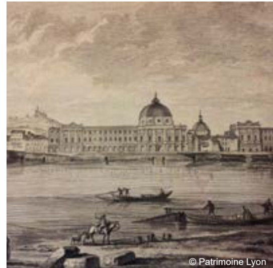
Façade de l'Hotel Dieu au XVIIe siècle

Il faudra attendre le 21 e siècle pour que la santé environnementale soit réaffirmée comme un enjeu urbain.