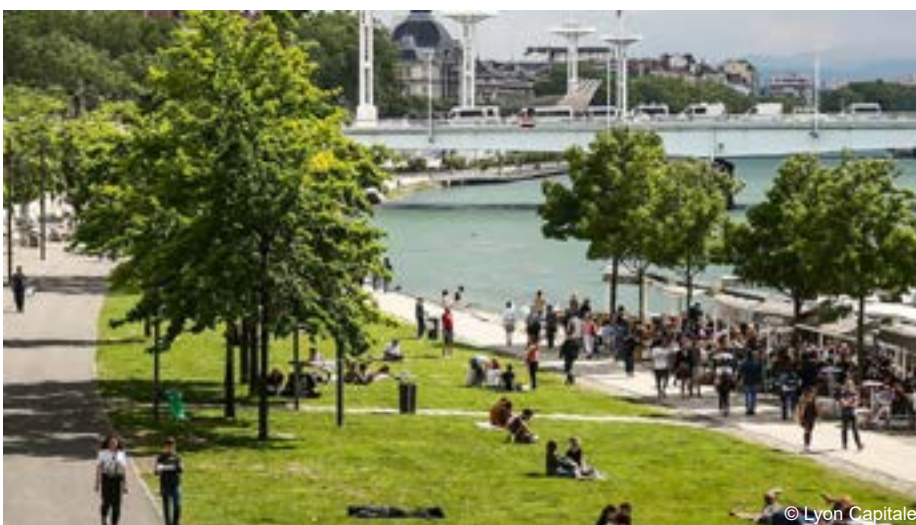
Berges du Rhône réaménagées en 2007

Le Parc de la Tête d'Or est créé en 1857 par les frères Bühler afin d'apporter de l'air pur et de la végétation en zone urbanisée. Il est suivi du Parc de Parilly en 1937.