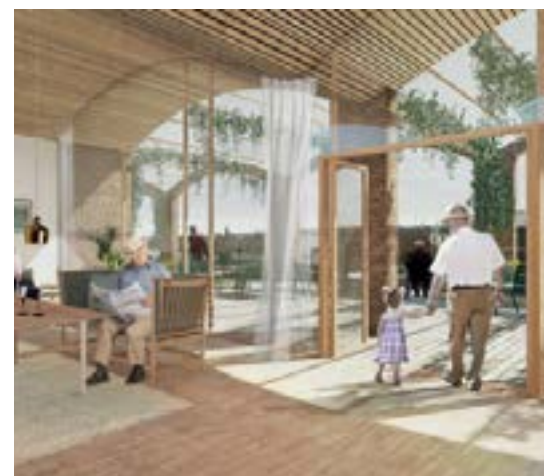
Projet Future Sølund « House of Generations » Résidence pour personnes âgées, qui accueille aussi des logements étudiants et un centre petite enfance avec des espaces communs, à Copenhague