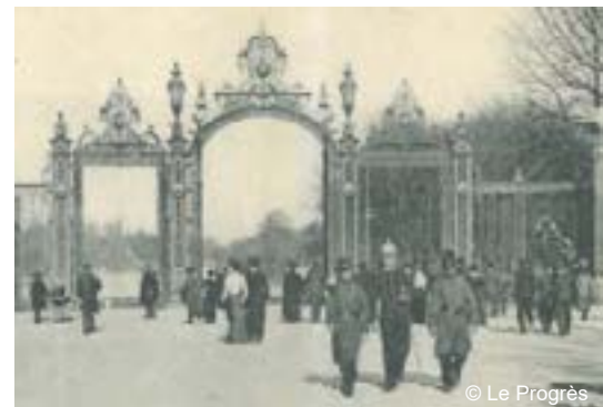
Porte des Enfants du Rhône - Parc de la Tête d'Or

Des difficultés financières vont l'obliger à vendre une part de son patrimoine au profit du plan Morand qui prévoit d'urbaniser toute la rive gauche du Rhône.