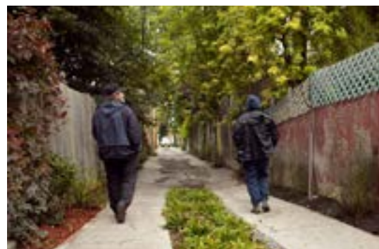
Ruelle verte Laval

ont été imaginés dans les ruelles vertes existantes pour y inclure les notions d'activité physique et de déplacements actifs. Afin que les enfants – et leurs parents – se réapproprient ces espaces publics, le Regroupement des Écoquartiers en collaboration avec la ville, a créé quatre parcours verts et actifs de 5 kilomètres au cœur de quatre arrondissements de Montréal. Une application permet de les localiser.