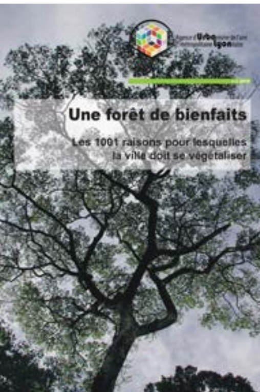
© Urbalyon, Les 1001 raisons pour lesquelles la ville doit se végétaliser, 2019

1°C de réchauffement sur cinq années est associé à une hausse de 2 % de la fréquence des problèmes de santé mentale. N. Obradovich, PNAS, 2018