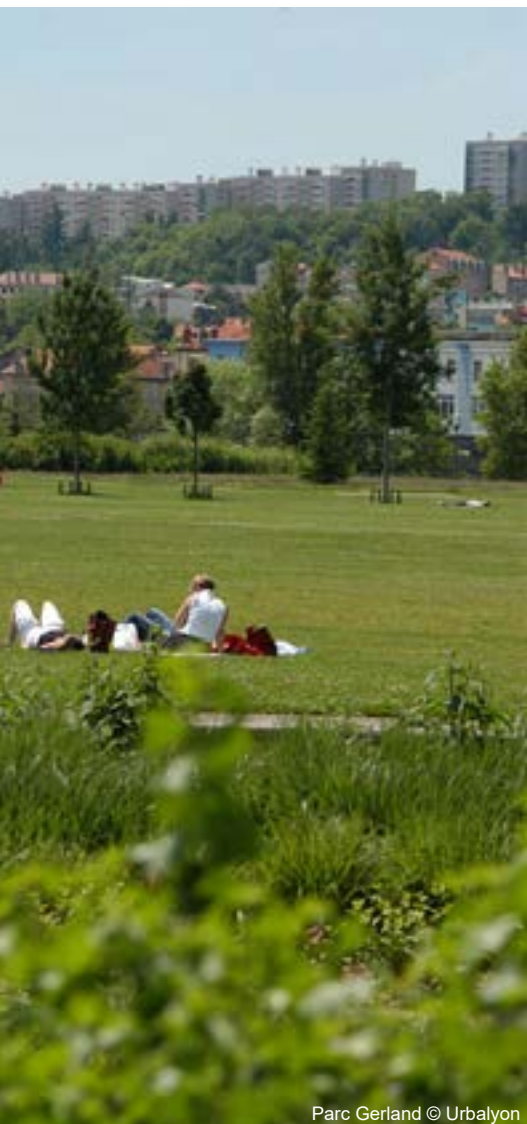
Parc Gerland