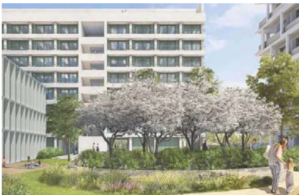
Eureka Confluence Ilot Santé

La programmation ne s'est pas limitée au bâtiment, ni à l'offre médicale. Il se veut ouvert et débordant sur un cœur d'îlot qui prend la forme d'un écrin de nature, incitant au repos, à la détente et qui accueillera peut-être même un jardin thérapeutique, aux nombreuses essences végétales.